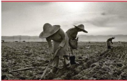
KONFERENCË NDRËKOMBËTARE SHKENCORE